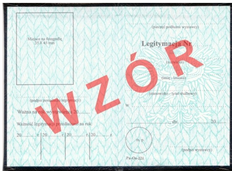
Wzór legitymacji ankietera stałego