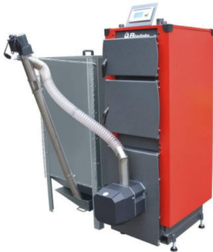
Piec na pellet