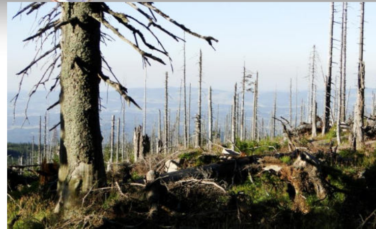
↑ Las w Sudetach po opadach kwaśnych deszczy

Kwaśne deszcze powstają poprzez wytworzenie kwasów, głównie z tlenku siarki i siarkowodoru, które są emitowane do atmosfery na skutek procesów spalania paliw czy różnych produkcji przemysłowych.