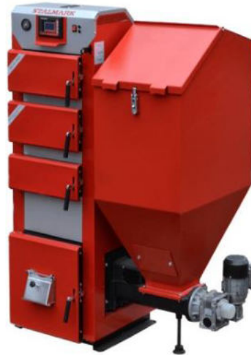
Piec na ekogroszek